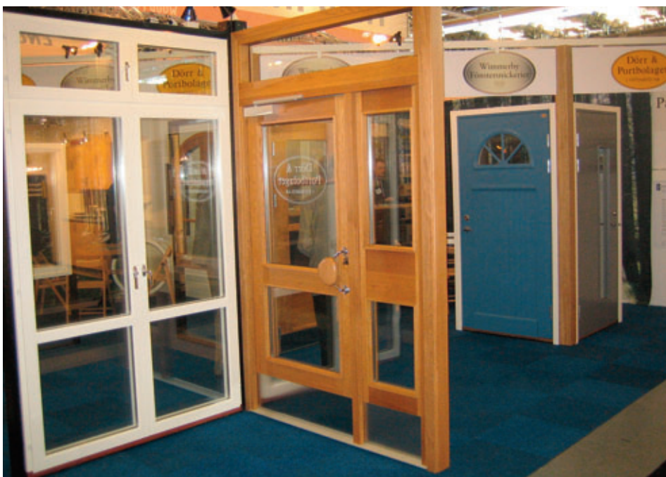
Den färdiga montern på Nordbygg. Ett projekt i samarbete med Wimmerby Fönsternickeri.

Inför Nordbygg gjorde Dörr & Portbolaget ett utskick med inbjudan och biljett till mässan. Ett femtiotal inbjudningar distribuerades, och i efterhand kunde man konstatera att runt hälften av de inbjudna besökte montern och registrerade sig. Ett